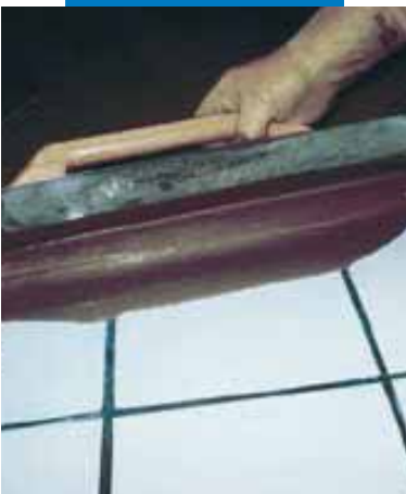
Нанесение Ultraplan металлическим мастерком поверх старых керамических полов после предварительной обработки составом Maprim SP