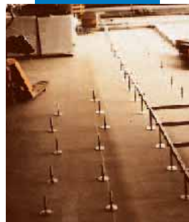
Перекрытие, выровненное с помощью Ultraplan под плавающий пол