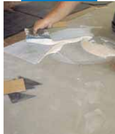
Пример укладки ПВХ (инкрустация) поверх выравнивающего слоя Ultraplan "CD 2" – Милан – Италия