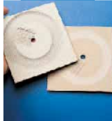
Результаты испытаний на истирание по методу Табера, выполненные на образце Ultraplan (справа) и обычном выравнивающем материале (слева) после 200 оборотов