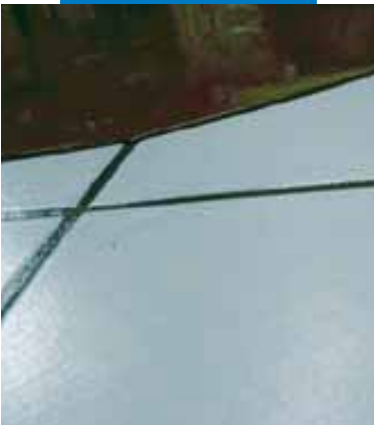
Деталь применения Ultraplan на старом керамическом полу после предварительной обработки составом Maprim SP