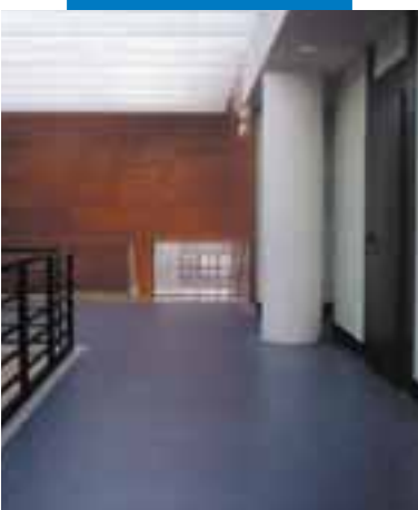
Пример укладки линолеумного покрытия поверх выравнивающей массы Ultraplan - Консерватория Монсон - Испания