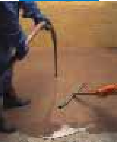
Нанесение Ultraplan насосом с последующей обработкой скребком

Нанесение слоя Ultraplan готовит поверхности для укладки упругих, текстильных, керамических и деревянных половых покрытий, которые могут быть приклеены по прохождении 12 при температуре при +23°C (это время может