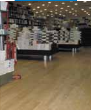
Пример укладки дерева поверх выравнивающей массы Ultraplan Музыкальный магазин "Мессаджерие Музикали" - Рим - Италия